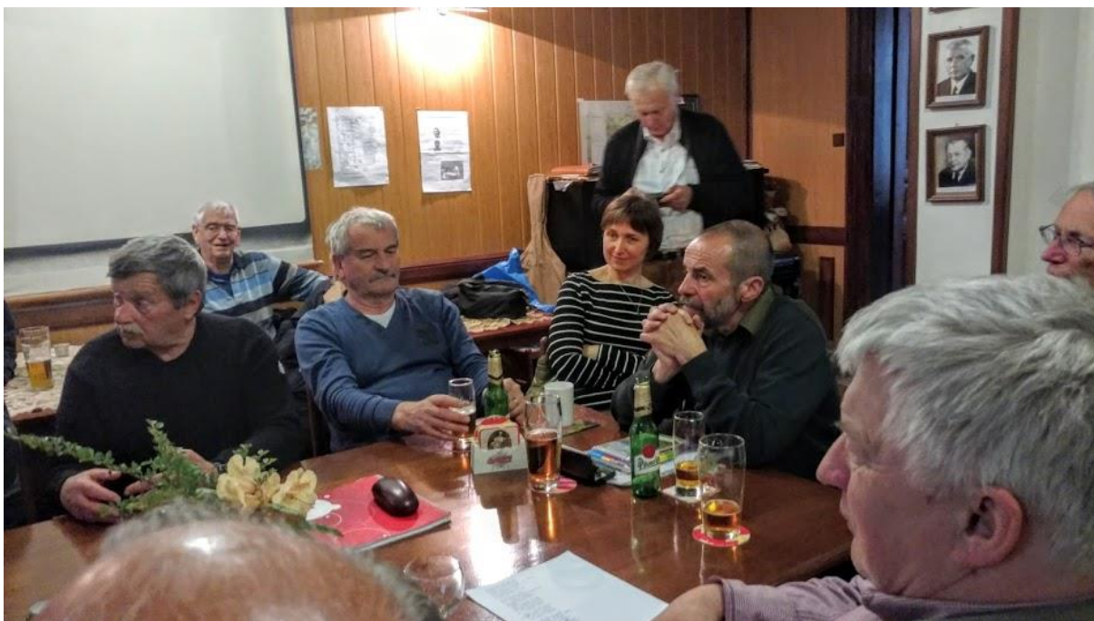
Nad všemi se tyčí Přmík