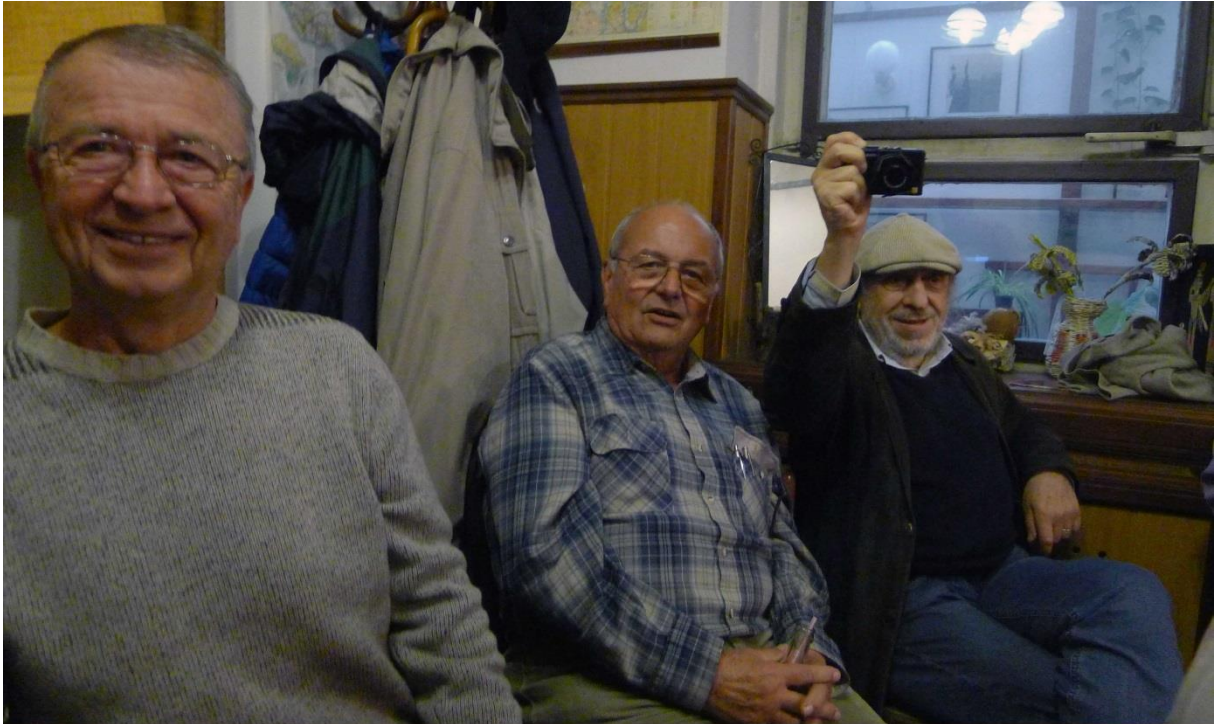
Smeták, Pegas, Kačka