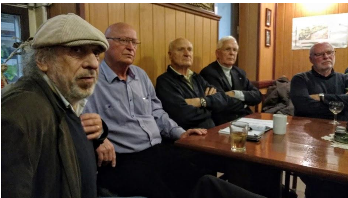
Výrazy svědčí o tom, že jsme jednali i o vážných věcech