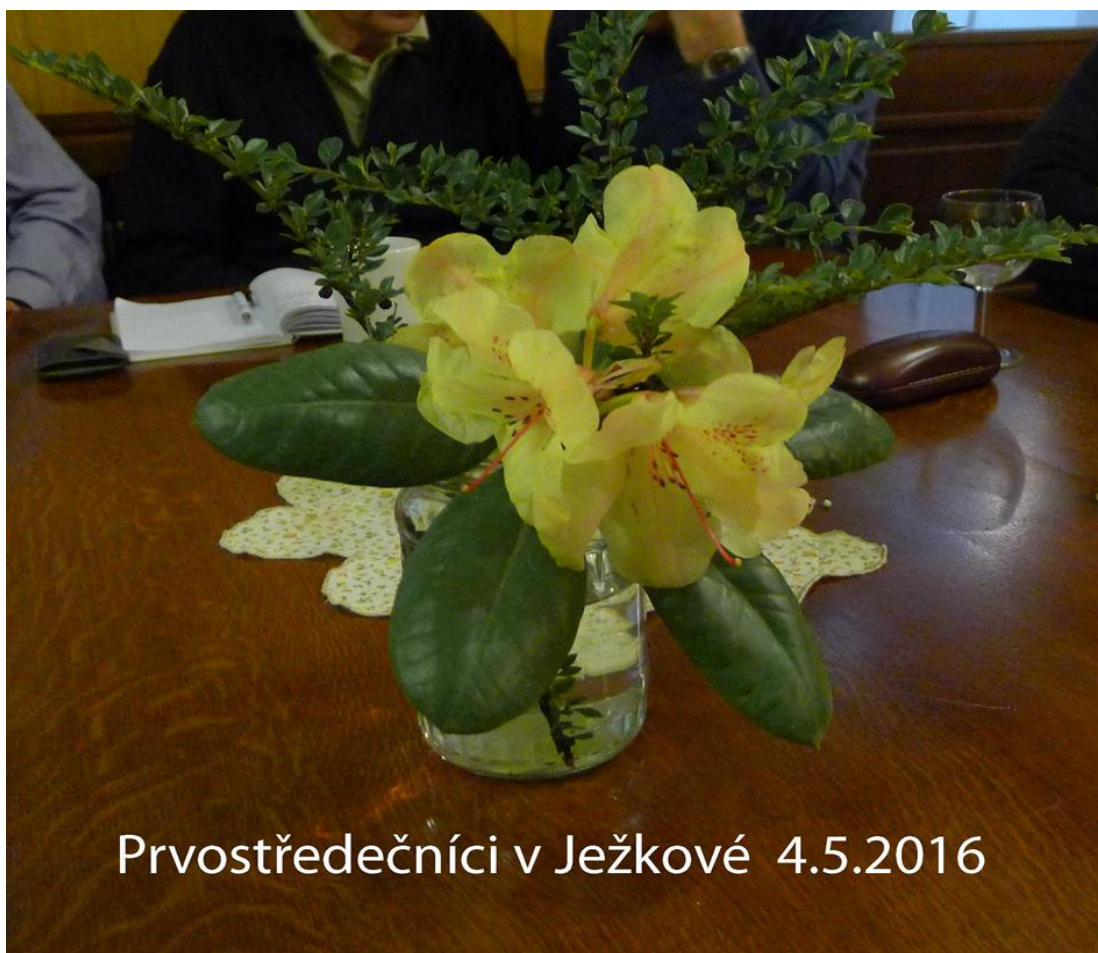
Prvostředečníci v Ježkové 4.5.2016